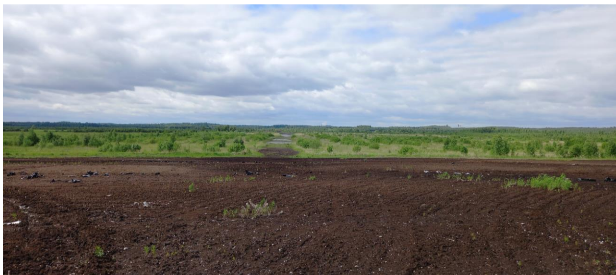
Kuva 3. Konnunsuon turvetuotantoalue, näkymä Kotasaarentieltä länteen (2022)