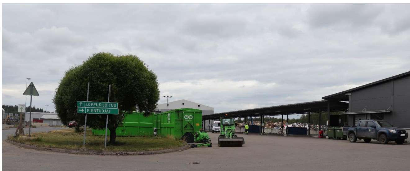
Kuva 4. Kukkuroinmäen käsittelykeskus (2019)